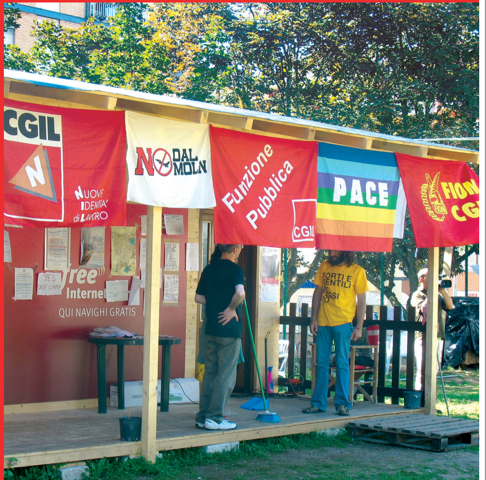
Nella foto il Forum per la ricostruzione in piazza Unicef a L'Aquila